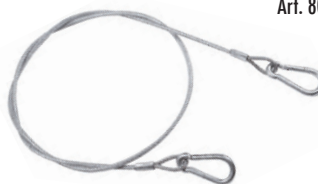
Art. 80 | Cavo di sicurezza Safety cable

Il cavo di sicurezza è fortemente raccomandato unitamente all'utilizzo di ogni tipo di morsetto e gancio di tiro